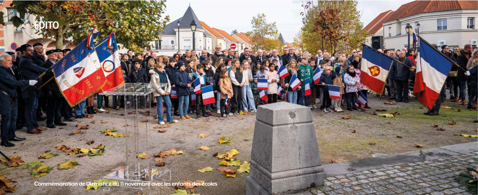
Commémoration de l'Armistice du 11 novembre avec les enfants des écoles